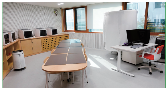
4층 3D 메이커스실