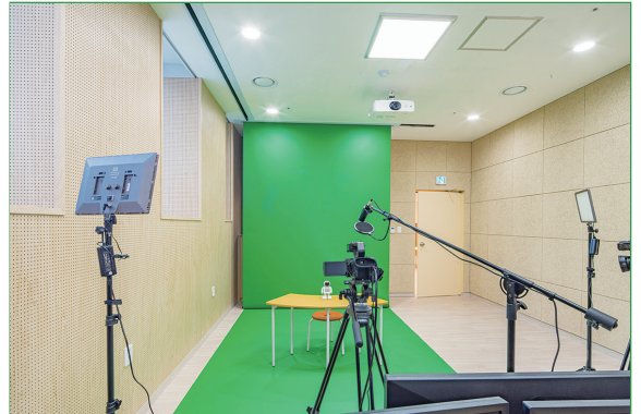
창작실 내 창작스튜디오