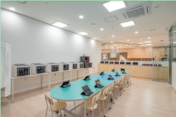
창작실 내 창의메이커룸