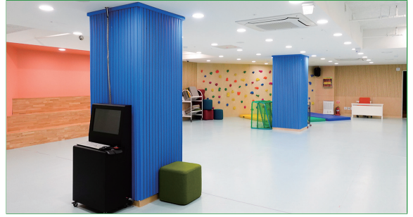
지하1층 플레이방(다목적 체육실)