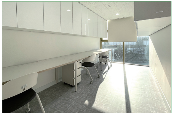
4층 TA 상주 공간