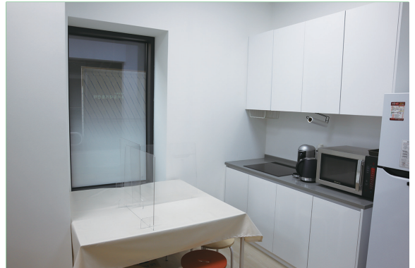
TA 상주 공간(창작실)